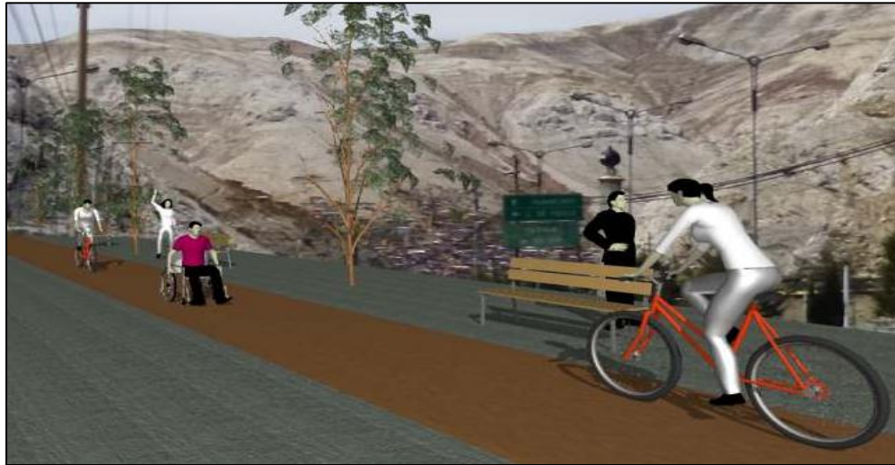
Imagen N° 5.6.1.5 Red de ciclovías en la vía arterial Evitamiento

Elaboración: Equipo técnico PDU Huaral 2016-2025