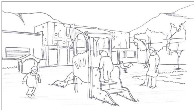
Imagen N° 5.1.2.1.B RED EDUCACIÓN Y CULTURA

Hay una buena dotación de centros de educación inicial, primaria y secundaria, apoyando la educación de jóvenes en la ciudad. En ciertos sectores la problemática es el estado de la infraestructura de los edificios; en otros lugares se necesita equipar con mobiliario, instrumentos y equipos tecnológicos.